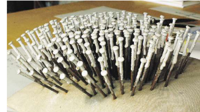
Günther Uecker: „Nagelobjekt“(o.) und „Stuhl“. Mit den oft bemalten Nägeln transformiert der Künstler Alltagsgegenstände.