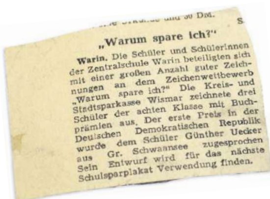
Die erste Zeitungsnotiz: 1949 hatte Günther Uecker einen Schülerwettbewerb gewonnen. Für seinen Plakattendruck zum Thema „Warum spare ich“ erhielt er als ersten Preis ein Buch.