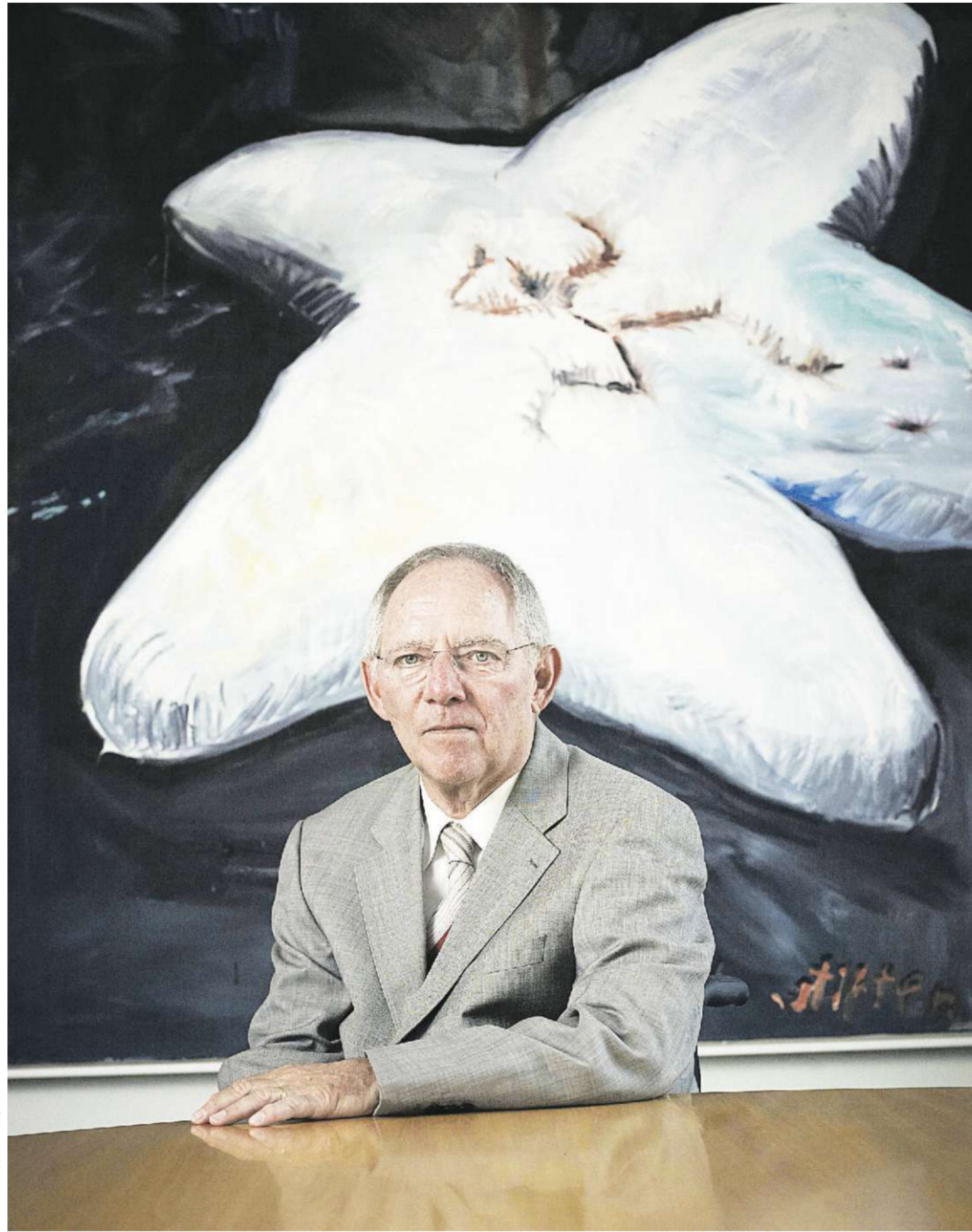
Bundesfinanzminister Wolfgang Schäuble in seinem Büro vor einem Gemälde von Jörg Immendorff

Handelsblatt: Aber in der ökonomischen Welt - an der Spitze marschiert Ifo-Präsident Hans-Werner Sinn - finden Sie fast keinen, der nicht sagt, die Umschuldung ist das, was ohnehin am Ende steht. Also ein Teilverzicht der Gläubigerbanken und Gläubigerversicherungen.