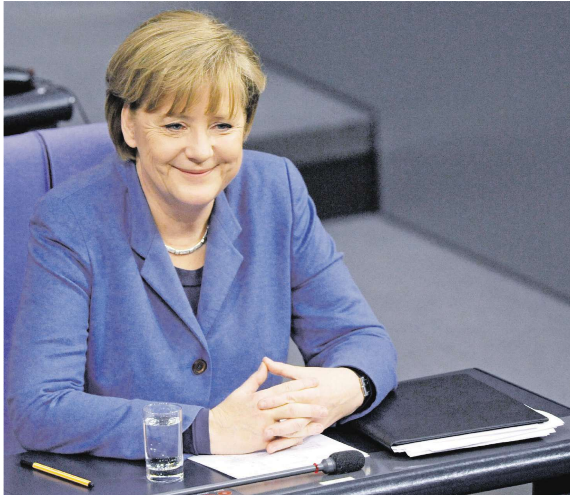
Angela Merkel, 11. März 2011

Und noch etwas stört viele CDU-Parteifreunde: der zunehmend präsidiale Stil der Kanzlerin. Die wichtigsten Entscheidungen bespricht Merkel in kleiner Runde im Kanzleramt vor. Die Parlamentarier sollen nachher nur noch zustimmen, klagen sie. Vor allem Bundestagspräsident Norbert Lammert mahnt die Regierungschefin zu mehr Transparenz in der Regierungsarbeit. Nach wie vor fühlen sich viele im Bundestag „in den zuständigen Gremien nicht ausreichend formuliert“, schrieb Lammert in einem Brief an Merkel. Mit Blick auf die Verfassung schob der Bundestagspräsident dann noch die Bitte nach, „sicherzustellen, dass die Bundesregierung den Deutschen Bundestag kundig und umfassend und zum frühestmöglichen Zeitpunkt informiert“.