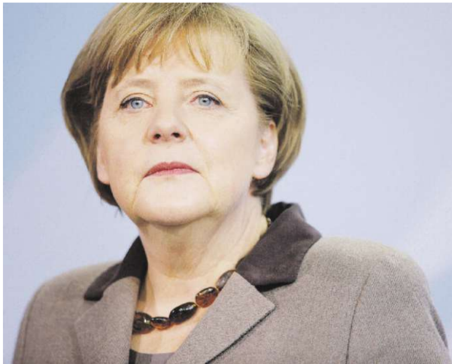
Bundeskanzlerin Angela Merkel